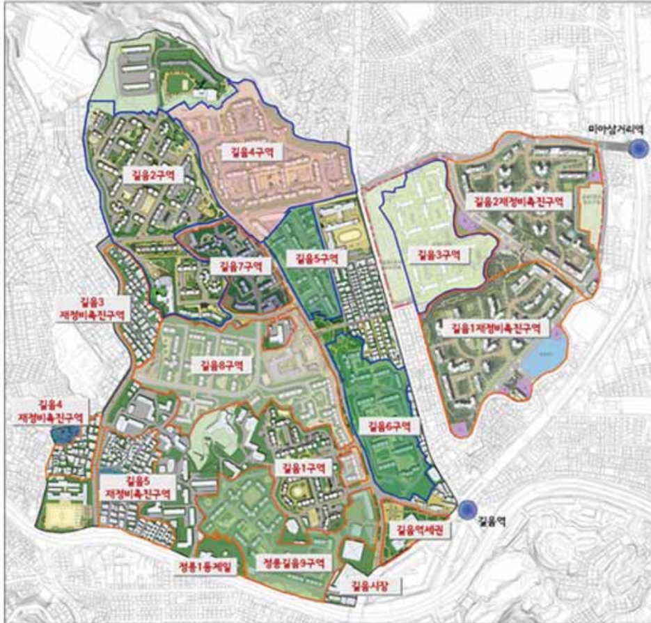
〈그림 2〉 길음뉴타운 사업구역도

관한 법률 시행령 제68조 및 제 70조 제2항의 규정에 따라 2009년 기반시설 단위당 지출비용 중 공원 1㎡당 79,000원 자료를 바탕으로 금액을 산출하였다. 공원 및 녹지 구입비용은 18,392백만원이 지출되고 공원 및 녹지 조성비용은 1,510백만원이 지출되어 총 19,903백만원이 지출되었다. 기반시설비용의 총지출은 25,947백만원으로 사업시행자인 조합에서 부담을 하였다.